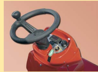
Panel de fácil lectura – sencillo manejo Painel de fácil leitura — fácil manejo

A utilização deste tipo de superfície e a sua exposição a determinadas condições meteorológicas fazem com que fiquem depositados resíduos sobre a camada de uso e a penetrem pouco a pouco. Se esta sujidade não for removida, as condições desportivas do pavimento podem ser afectadas. No caso da relva artificial sem cargas de enchimento, como a utilizada em hóquei sobre erva, os resíduos, a areia e o pó em suspensão podem fazer surgir algas e outras plantas na superfície do campo que finalmente deterioram a relva e provocam escorregadelas aos jogadores, para além de estragar a imagem da instalação. No caso das pistas de atletismo acontece a mesma coisa, pois a acumulação de pó e areia sobre a superfície pode causar escorregadelas e lesões. O acessório de limpeza para este tipo de superfícies da SportChamp conta com duas escovas contrarotativas que levantam a sujidade ao mesmo tempo em que absorve pela turbina de aspiração. Também tem integrada uma escova lateral para as zonas de difícil acesso, esquinas ou corredores. A versatilidade e fiabilidade da SportChamp fazem dela uma aquisição muito rentável que ajuda a proteger o investimento feito em um relvado sintético ou uma pista de atletismo, ao mesmo tempo em que conserva as suas propriedades desportivas. O funcionamento da SportChamp foi analisado pelo IBV.