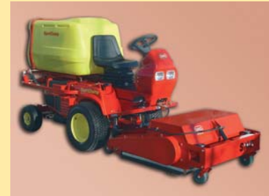
SportChamp SC2B; el modelo estándar SportChamp SC2B; o modelo standard