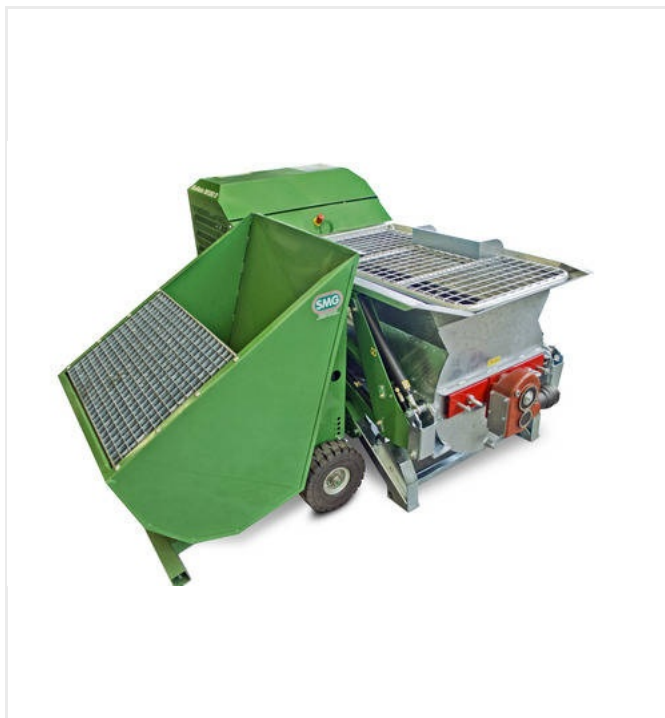
Carretilla de carga para una alimentación fácil y eficiente de las mezclas