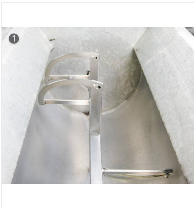
Recipiente con las aspas de mezcla