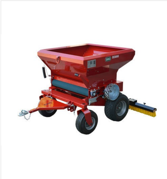
Recebadora BS800, Art.Nr. 6221306