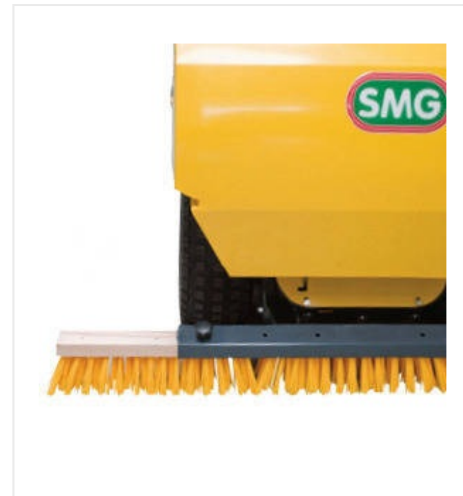
Línea de cepillos elevables